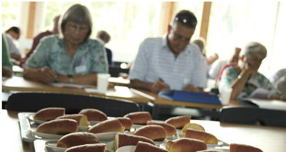
ZHAW, Fachstelle Ernährung